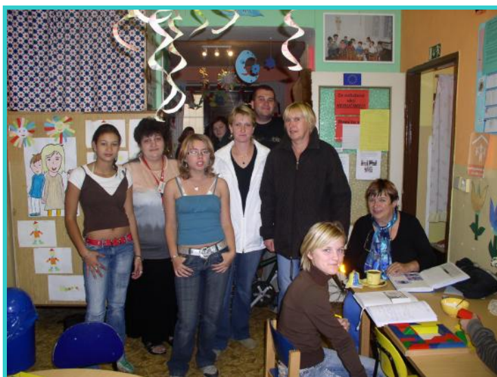
Společné foto s pracovníky

Ve středu 24. září 2008 se žáci 7. – 9. ročníku v rámci Týdne nízkoprahových klubů II zúčastnili exkurze do nízkoprahového zařízení pro děti a mládež v Roudnici nad Labem. Měli zde možnost vidět videoprojekci s ukázkami romských tanců, prohlédli si taneční kroje, nahlédli do kroniky klubu a zahráli si různé hry. Také se dozvěděli informace, které se týkají nabídky volnočasových aktivit pro děti z nepodnětného prostředí.