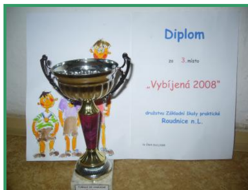
Pohár za 3. místo